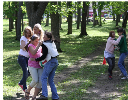
Teatevõistlus