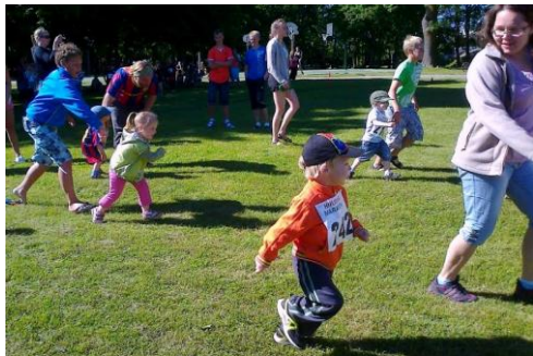
Kõige väiksemad jooksjad jaanijooksul

22. juunil toimus juba traditsiooniline jaanijooks, kus osalejateks lapsed vanusest 3-4 aastased kuni eakate jooksusõpradeni välja. Kõigile olid jõukohased distantsid ja osalejaid oli jooksul üle 120-ne. Hea korraldus, pikad traditsioonid ja rikas auhinnalaud toob kohale jooksjaid üle Hiiumaa ja ka väljastpoolt kodusaart, sekka mõned välismaalasedki. Osalejatele paistab meeldivat ka see, et lisaks parimatele on võimalus loosiauhind võita igaühel.