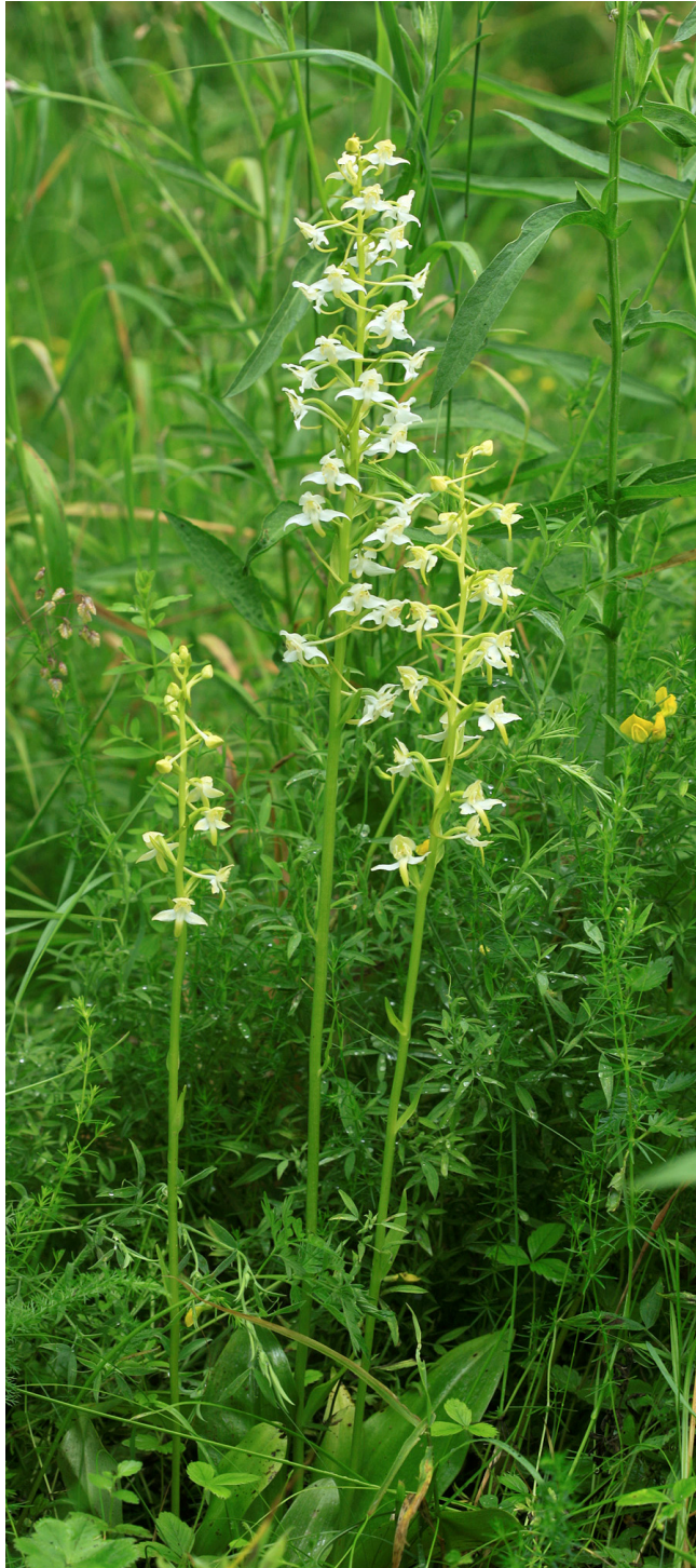
▲ Rohekas käokeel →

Mõlemad käokeeled kuuluvad kaitsealuste liikide III kategooriasse. Looduslikult ohustavad neid nagu paljusid teisi mugulaga käpalisi metssead. Viimastel kümnenditel on nende liikide arvukus vähenenud kasvukohtade hävimise tõttu. Paks kulukiht ja tihe kadastik saavad saatuslikuks ka kõige visamatele.