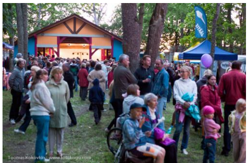
Kõrgessaare jaaniohtu